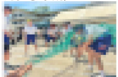
生徒会種目「土中フェスティバル」