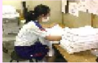
オリビアン小豆島 夕陽ヶ丘ホテル