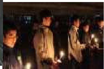
キャンドルサービス