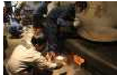
うちこみうどん作り