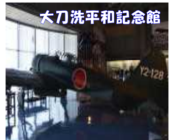
大刀洗平和記念館